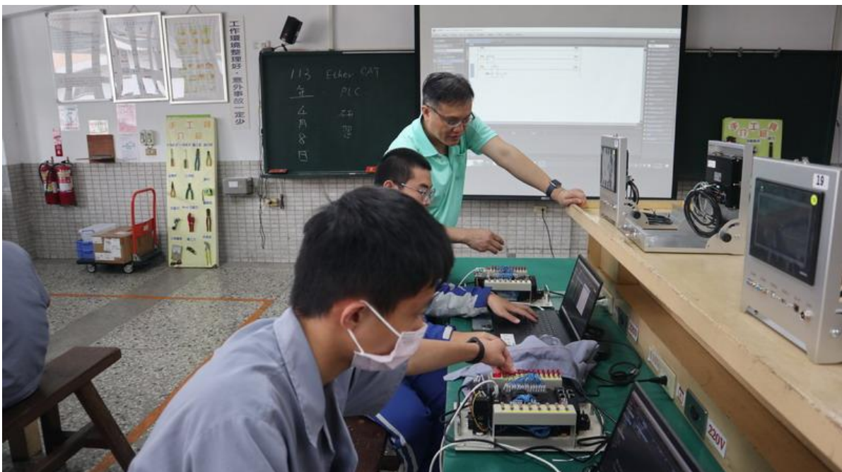
講師指導同學程式設定情形