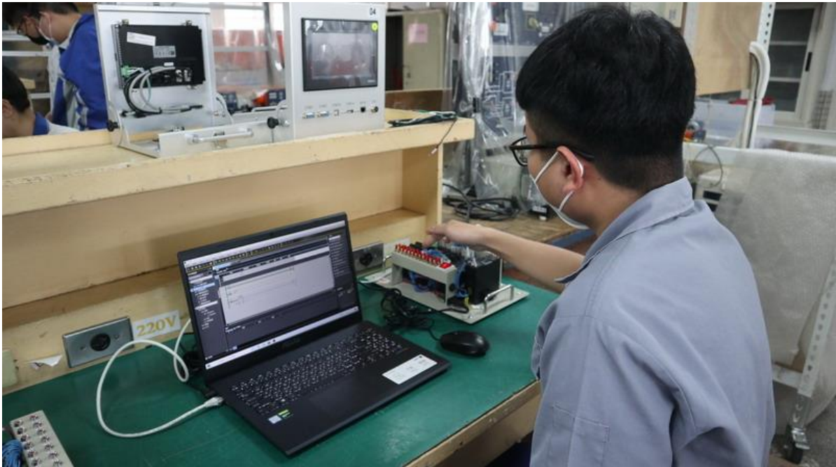
同學連接周邊設備情形