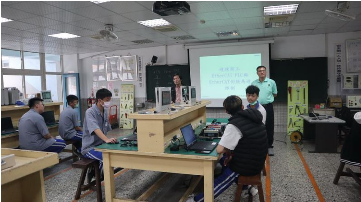
嘉鴻科主任介紹講師情形