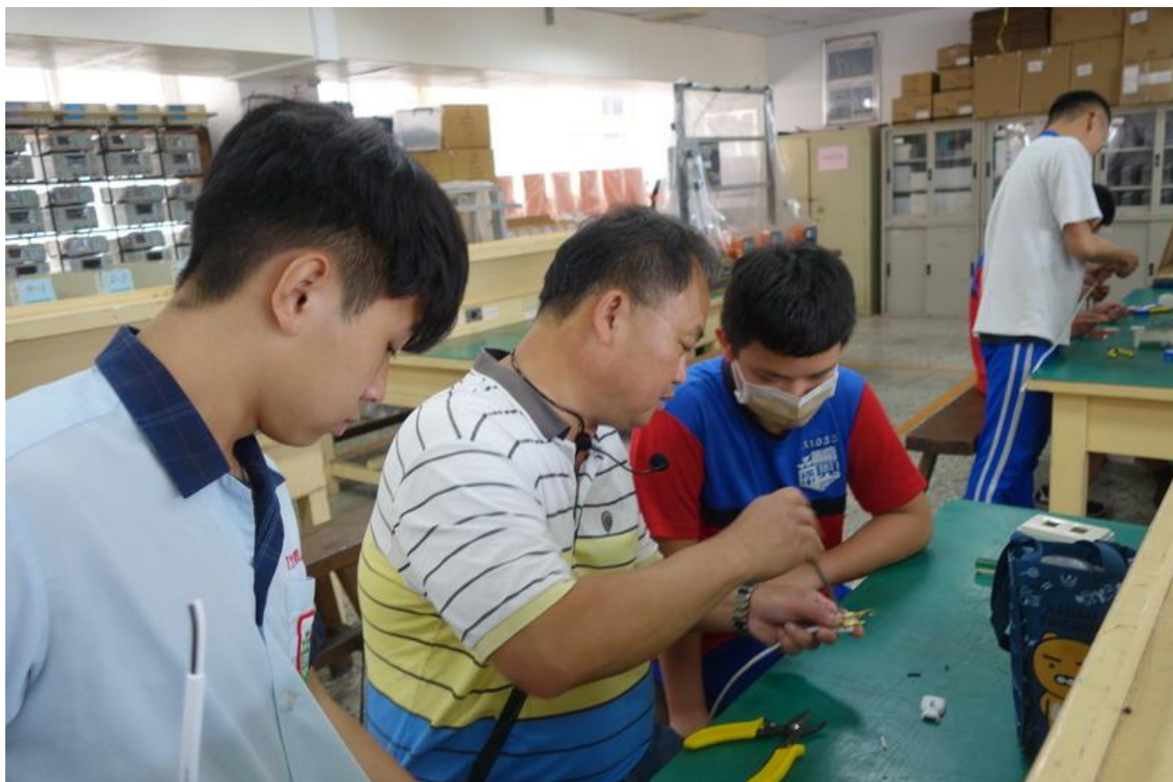
羅組長教導同學將白扁線線接上插頭情形