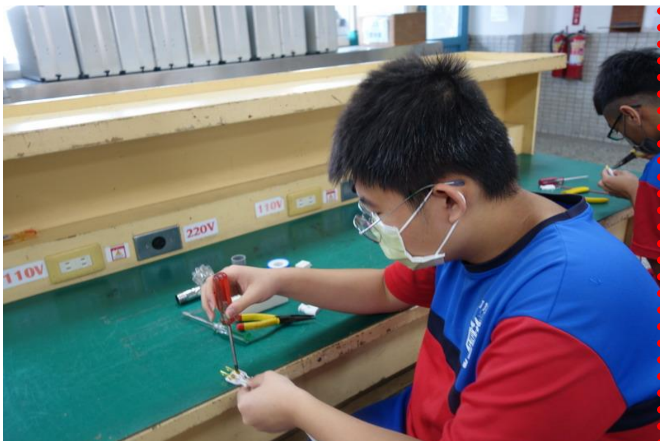
同學將白扁接鎖上插頭情形