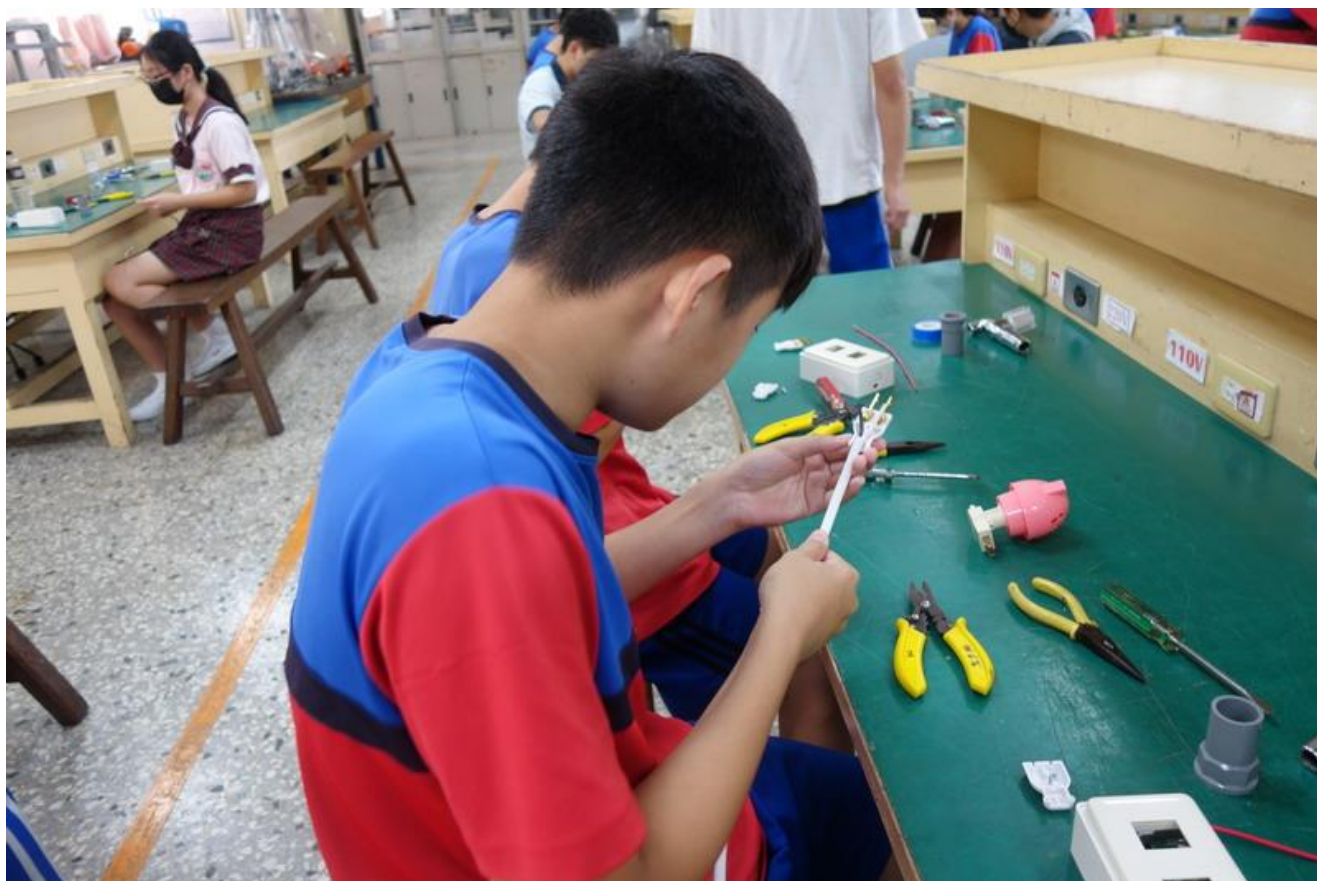
同學將白扁線撥線情形